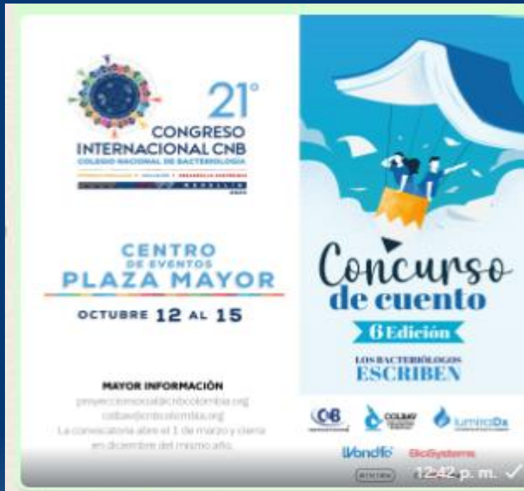
Lanzamiento 6 Concurso de cuento