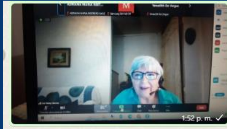
Primer lugar Concurso de Cuento “Los Bacteriólogos Escriben. Dra.Fanny Gaviria